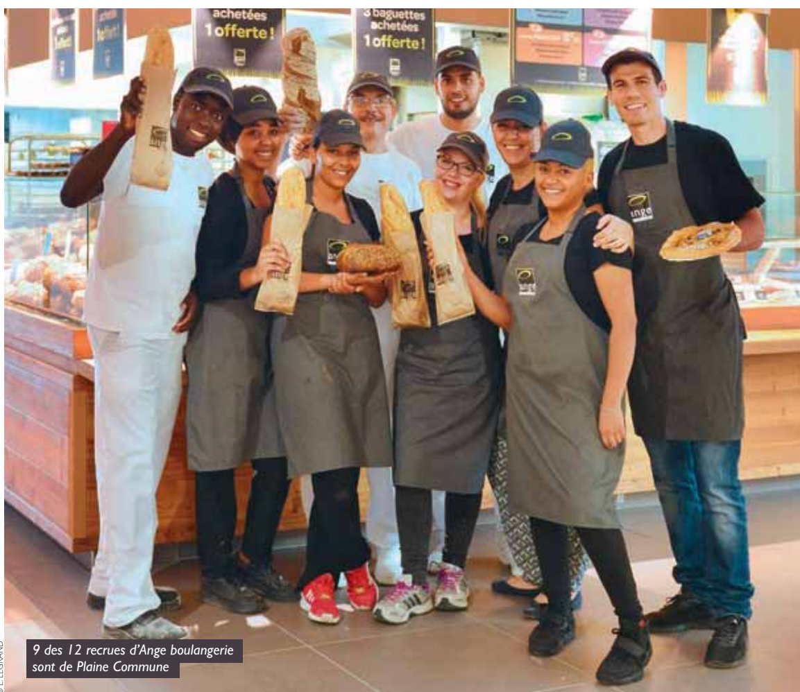
9 des 12 recrues d'Ange boulangerie sont de Plaine Commune

Ouverte depuis le 22 juin à Villetaneuse, la boulangerie Ange est la petite dernière de ce réseau de franchise qui comporte 68 enseignes.