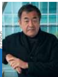
Kengo Kuma, architecte, concepteur de la gare Saint-Denis-Pleyel

« Pour cette gare, j'ai voulu créer un point de rencontre pour le quartier de Pleyel. Ce point de rencontre est créé par l'idée d'une spirale, rassemblant à la fois les gens, les activités et l'énergie de la foule. Je pense que ce quartier a besoin d'espaces publics. Nous avons donc imaginé trois types d'espaces : le parvis de la gare, les jardins suspendus en terrasse et le cœur même de la gare. Je crois qu'avec ces trois lieux différents, le style de vie de ce quartier peut être modifié. La gare sera également un lieu de rassemblement où seront programmées toutes sortes d'animations culturelles telles que musique, danse, conférences, expositions, etc. dans un complexe d'environ 5 000 m 2 . »