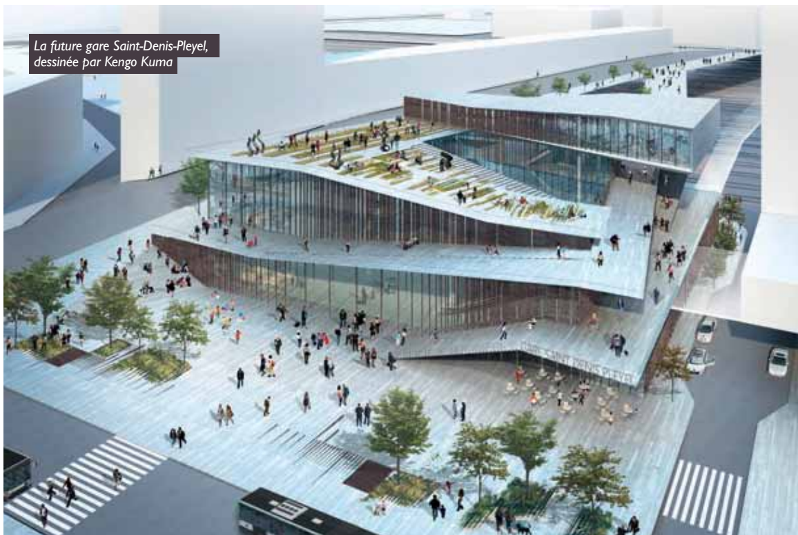
La future gare Saint-Denis-Pleyel, dessinée par Kengo Kuma

recte de réputation internationale, le Japonais Kengo Kuma, qui vient d'être désigné pour réaliser le stade des Jeux Olympiques de Tokyo en 2020. La gare qu'il a dessinée pour le quartier Pleyel joue beaucoup sur les effets de transparence et de lumière afin de contribuer à la qualité des déplacements des Franciliens. Ils seront 250 000 à la fréquenter chaque jour ! S'organisant autour d'un atrium, la gare sera répartie sur neuf niveaux, dont quatre souterrains. Point stratégique du nouveau réseau, la gare Saint-Denis Pleyel deviendra un pôle unique de transports où convergeront quatre lignes du Grand Paris Express (lignes 14, 15, 16 et 17), à l'ouest, et le RER D et la ligne H du Transilien, à l'est, reliés par la future passerelle. La gare sera le point central d'un quartier qui va bénéficier d'un vaste programme d'aménagement. « L'objectif est de constituer un nouveau pôle d'intensité