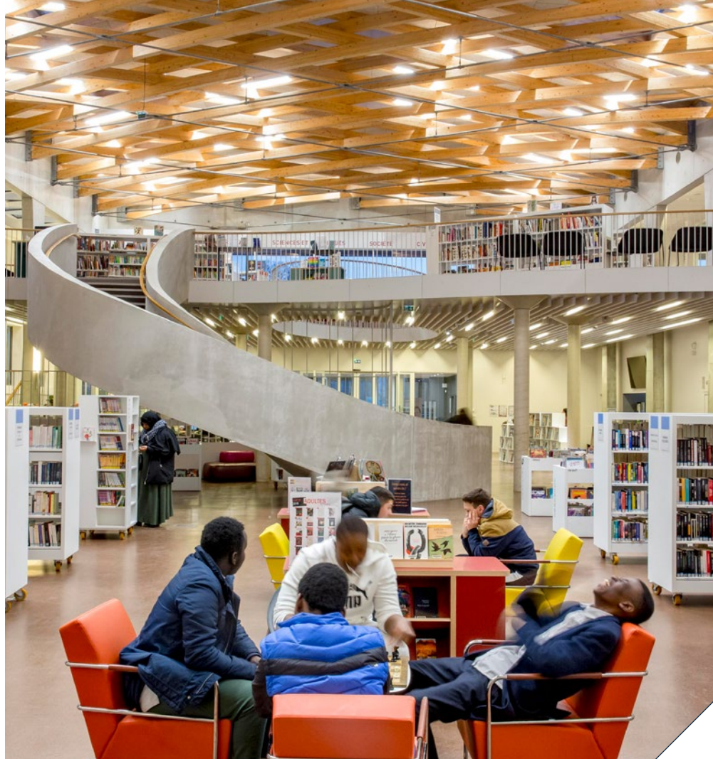
Médiathèque Louis Aragon - Stains

From live performance to graphic arts and from "high" to urban cultures, Plaine Commune is home to many talented artists, yours to discover in leading cultural venues... and just about everywhere else.