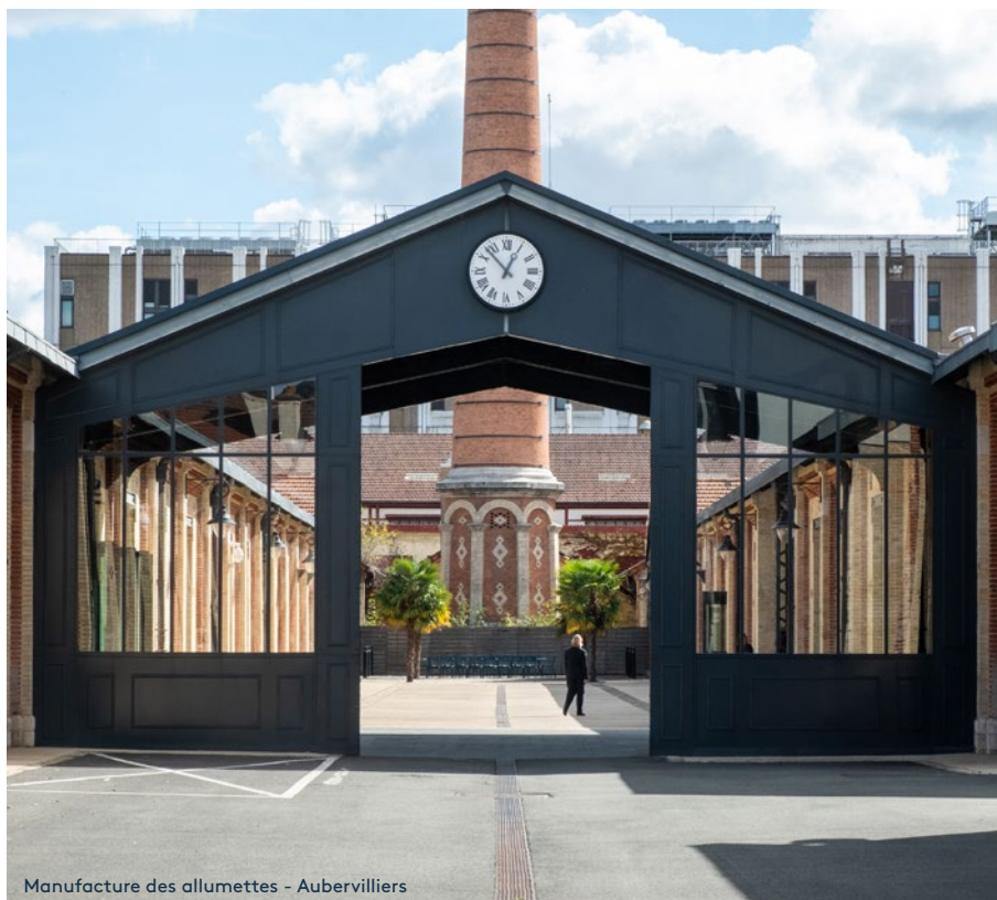
Manufacture des allumettes - Aubervilliers

Saint-Denis, Plaine Commune and the Département of Seine-Saint-Denis have submitted a joint application for the title of European Capital of Culture 2028. This candidacy, supported by the Périphéries 2028 association, will be based particularly on cultural sites steeped in history and that embody the urban transformation underway (the Babcock workshops in La Courneuve, the Éclair Labs site in Épinay-sur-Seine, Fort d'Aubervilliers, the 6b artist residence in Saint-Denis and more). The area's cosmopolitan character stands out as the strong point of its application, calling attention to the district's key assets including multiculturalism, youth, urban planning, etc. All around a strong symbol: the spire of the Saint-Denis Basilica, set to be re-erected in 2028.