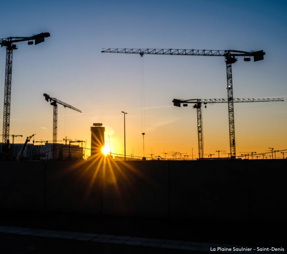
La Plaine Saulnier - Saint-Denis