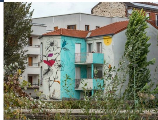
Street art avenue saison 4 - Œuvre de Fabio Petani

largest antique market in Europe spanning 7 hectares (17 acres). Not to mention the Stade de France, legendary venue of the 1998 Soccer World Cup, as well as the 2007 Rugby World Cup, Euro 2016, Six Nations Championships, the World Athletics Championships and any number of shows and concerts. The stadium is currently preparing to host the future #France2023 Rugby World Cup and the 2024 Olympic and Paralympic Games.