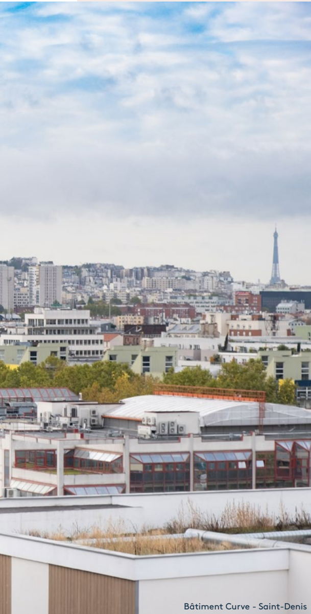
Bâtiment Curve - Saint-Denis

de bureaux fin 2022 million sq.m of office space by the end of 2022