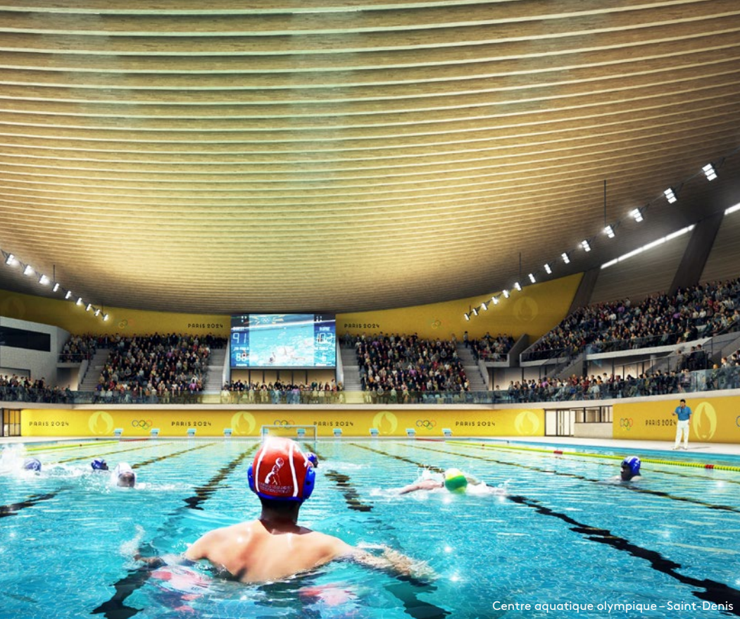
Centre aquatique olympique - Saint-Denis