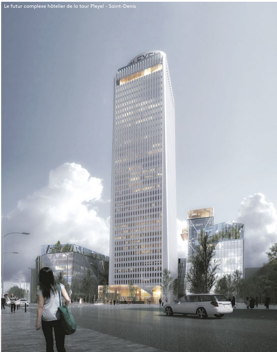
Le futur complexe hôtelier de la tour Pleyel – Saint-Denis

During and after the Games, expansion of the hospitality industry – not only in lodging, food and drinks, but also leisure activities, events, and more – will be a lasting source of local job creation to meet the ever-growing needs of leisure and business travelers.