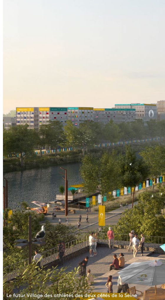
Le futur Village des athlètes des deux côtés de la Seine

Alors que la France attend entre 15 et 20 millions de visiteurs et 4 milliards de téléspectateurs, les projecteurs du monde entier seront braqués sur Plaine Commune. Les athlètes olympiques et paralympiques de la compétition, représentant plus de 200 nations, seront accueillis dans le Village des athlètes situé à Plaine Commune dans les villes de Saint-Denis, L'Île-Saint-Denis et Saint-Ouen-sur-Seine. Deux sites de compétitions majeurs, une épreuve sur route et les cérémonies de clôture des Jeux olympiques et paralympiques mettront le territoire à l'honneur. Cette médiatisation exceptionnelle permettra d'accroître la notoriété du territoire et de valoriser ses atouts touristiques, patrimoniaux, géographiques, culturels et économiques.