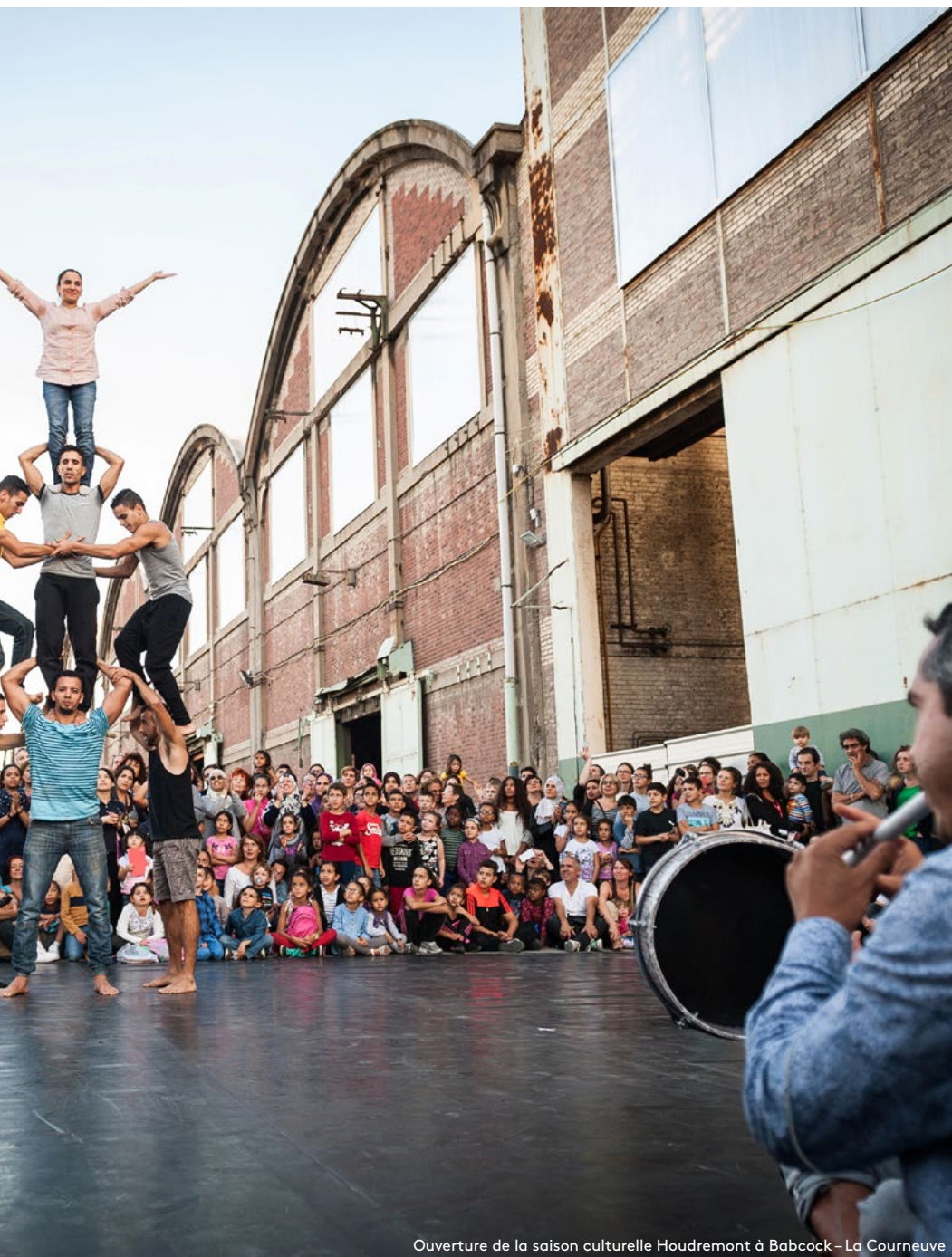
Ouverture de la saison culturelle Houdremont à Babcock – La Courneuve