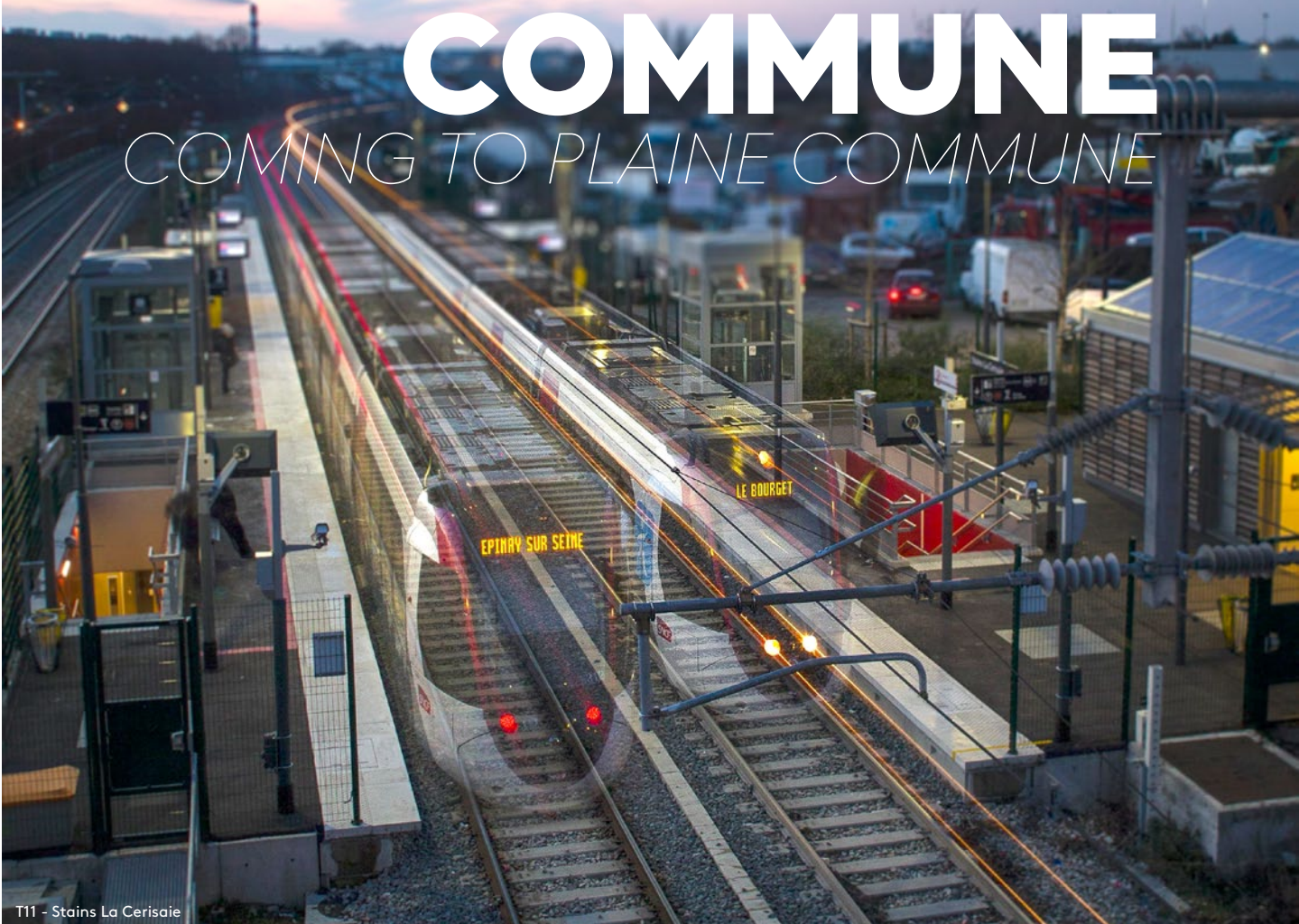
T11 - Stains La Cerisaie

Plaine Commune est particulièrement bien situé et facile d'accès, ce qui lui confère une situation exceptionnelle en Île-de-France.