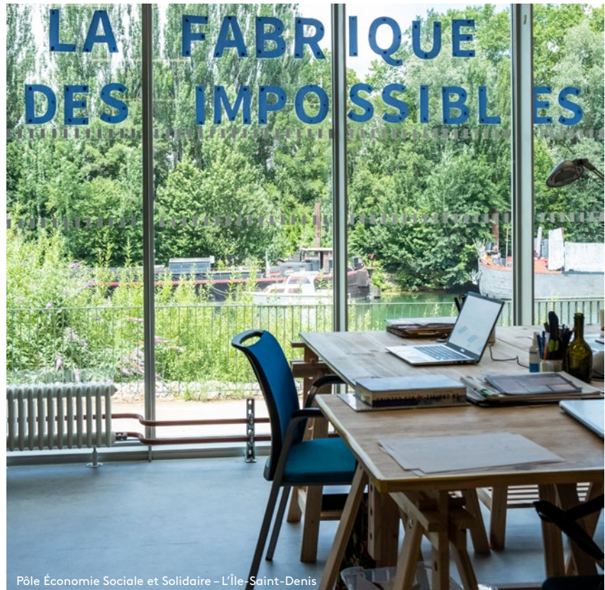
Pôle Économie Sociale et Solidaire – L'Île-Saint-Denis

Plaine Commune incite les acteurs de son développement urbain à s'engager dans une démarche d'aménagement soutenable. Ce projet de « métabolisme urbain » vise à appliquer les principes de l'économie circulaire au secteur du BTP. Sous l'impulsion de Plaine Commune, ce modèle novateur de réemploi, de réutilisation et de recyclage de matériaux du BTP interchangers doit être expérimenté sur 30 sites pilotes.