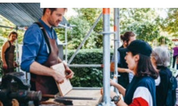
Démonstration tailleur de pierre, Saint-Denis

Ateliers d'art des Musées Nationaux www.ateliersartmuseesnationaux.fr