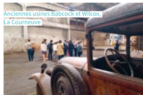
Anciennes usines Babcock et Wilcox, La Courneuve

La désindustrialisation des années 1970 impacte fortement le territoire : certaines traces de ce passé comme les gazomètres ont disparu, mais beaucoup d'autres sont encore visibles. De nos jours, Plaine Commune connaît une mutation vers les secteurs de la recherche, de l'image (audiovisuel et cinéma) ou encore des transports.