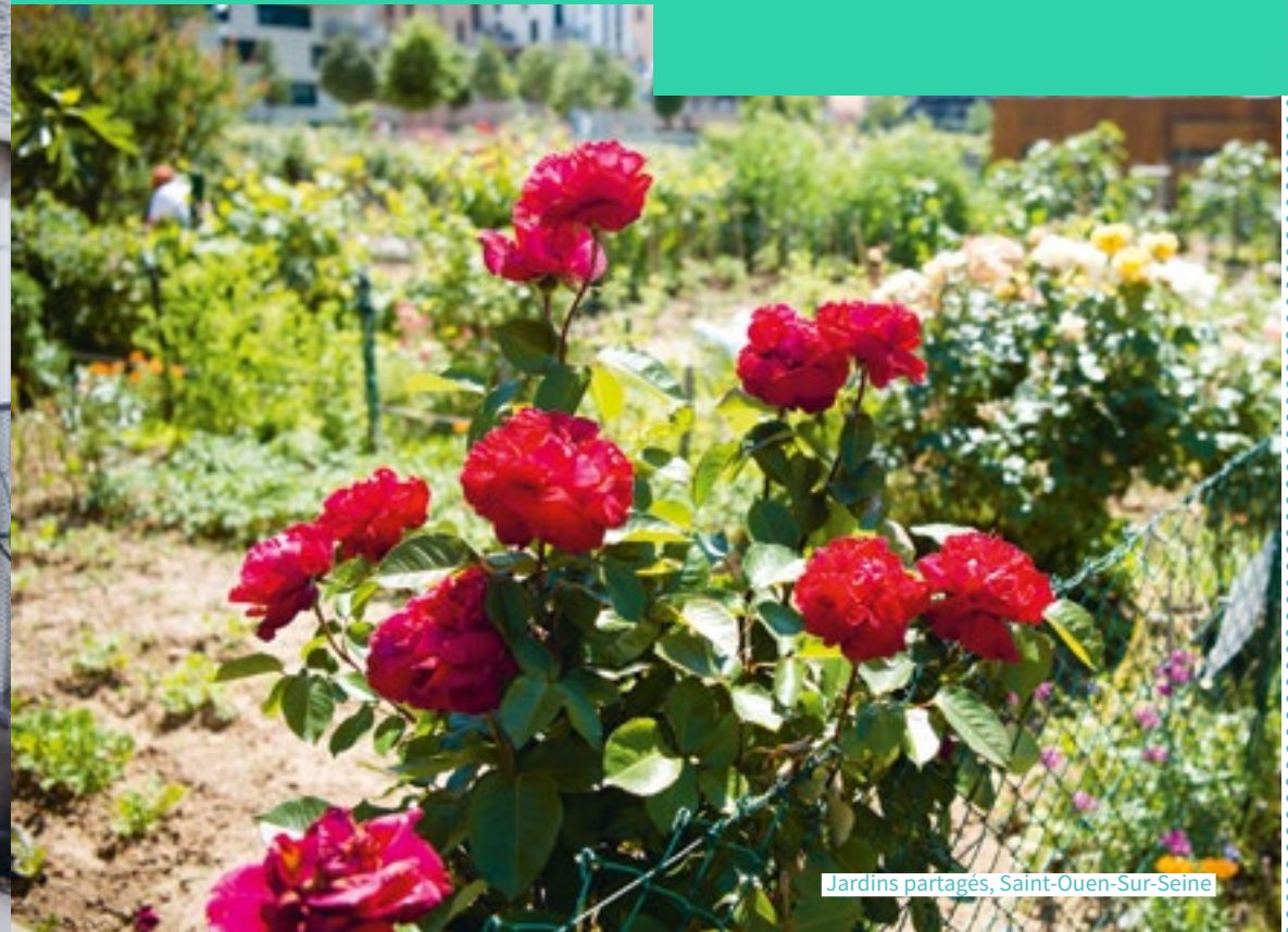
Jardins partagés, Saint-Ouen-Sur-Seine