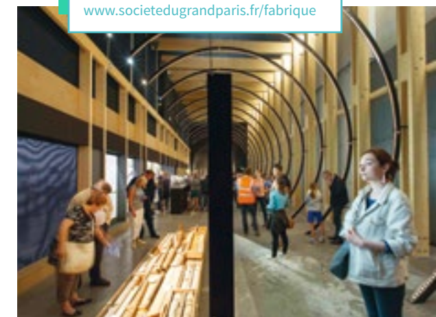
La Fabrique du métro, Saint-Ouen-sur-Seine

La Fabrique du métro www.societedugrandparis.fr/fabrique