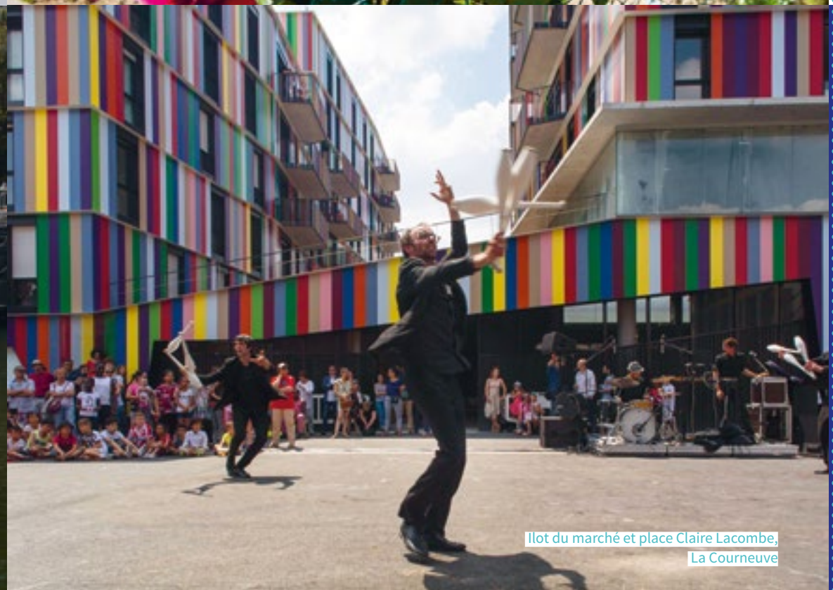
Ilot du marché et place Claire Lacombe, La Courneuve