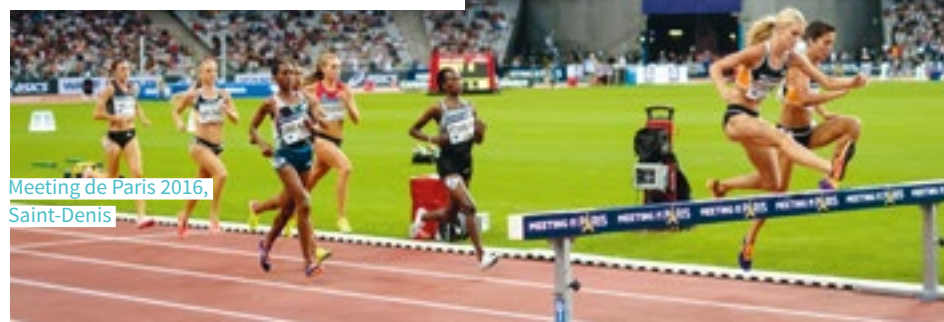
Meeting de Paris 2016, Saint-Denis

► Le Centre aquatique olympique sera construit à quelques centaines de mètres du Stade de France auquel il sera relié par une passerelle piétonne, ce qui facilitera le lien entre les deux sites et leurs quartiers. Pendant les Jeux, il accueillera les compétitions de natation, plongeon, natation artistique, para-natation, boccia et water-polo. Après les Jeux, ce centre aquatique composé d'un bassin modulaire de 50 m et d'un bassin de plongeon de 25 m, accueillera grand public et compétitions internationales.