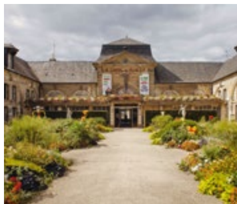
Hôtel de ville, Stains

C'est au château de Boisfranc que Louis XVIII a signé en 1814 la « déclaration de Saint-Ouen » qui, tout en rétablissant la monarchie, reconnaît les principales conquêtes politiques et sociales de la Révolution. Louis XVIII fait par la suite construire à cet emplacement un nouveau château qu'il offre à sa favorite, la comtesse du Cayla. Le château de Saint-Ouen est aujourd'hui l'un des rares exemples d'architecture de style Restauration. Accueillant le conservatoire de musique de Saint-Ouen-sur-Seine, il pourrait être transformé en musée de la Restauration.