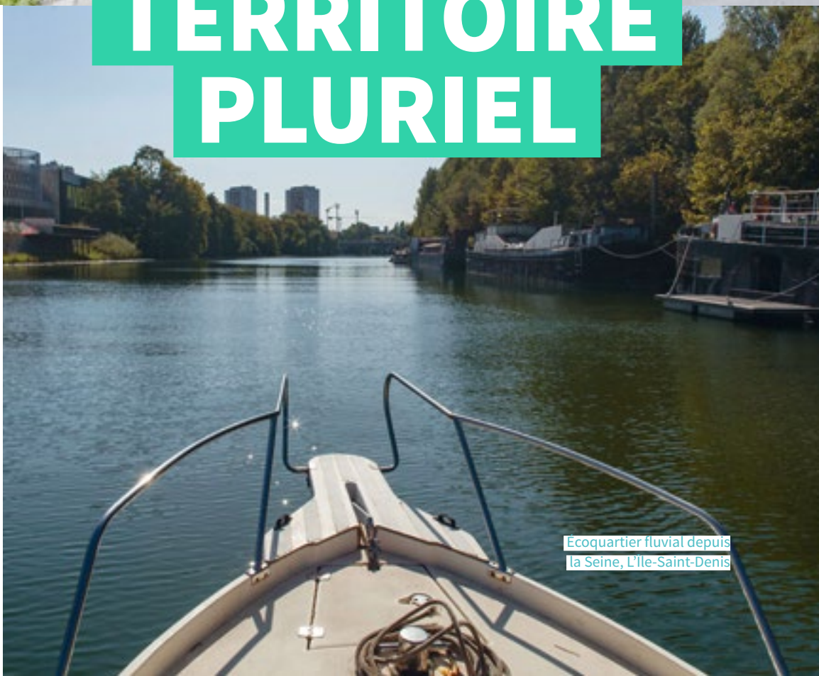
Ecoquartier fluvial depuis la Seine, L'Île-Saint-Denis