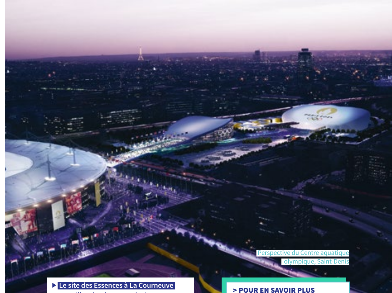
Perspective du Centre aquatique olympique, Saint-Denis

► Le site des Essences à La Courneuve accueillera les épreuves de tir et de para-tir sportif.