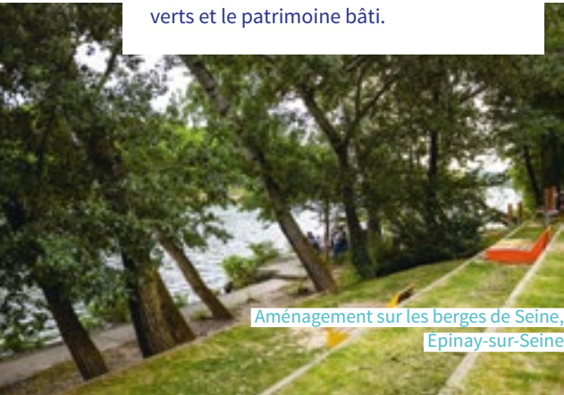
Aménagement sur les berges de Seine, Épinay-sur-Seine

► L'ancien chemin de halage à Épinay-sur-Seine a conservé son caractère naturel. De nouveaux aménagements permettent de s'y promener et s'y reposer, tout en admirant la Seine, les espaces verts et le patrimoine bâti.