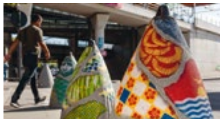
Œuvre de Guate Mao sur les bornes de sécurisation, Saint-Denis

Œuvre d'Alexandra Arango sur les piliers de l'A86, canal Saint-Denis ; Œuvre du duo Telmo Miel sur une façade, Saint-Denis ; Œuvre de Maclaim sur une façade, Saint-Denis