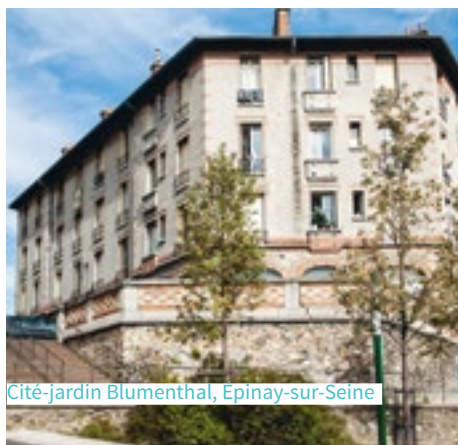
Cité-jardin Blumenthal, Épinay-sur-Seine

d'Orgemont, l'une des plus grandes d'Île-de-France, intègre des équipements plus variés.