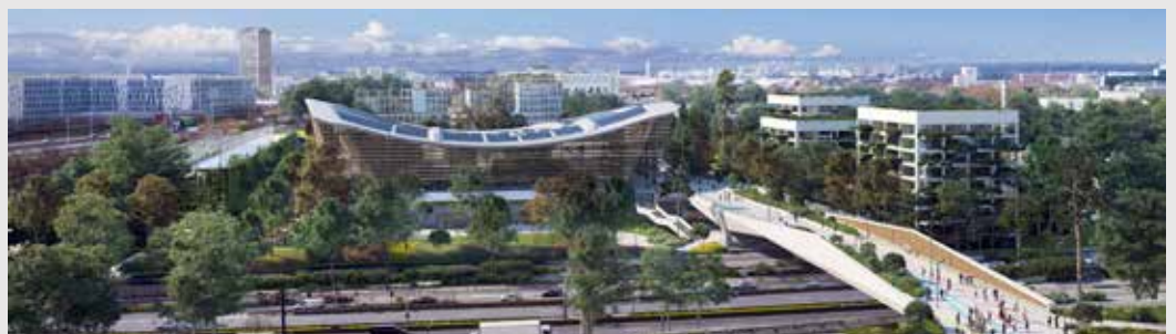
© ARCHITECTURE:VENHOEVENS & ATELIERS 2/3/4/ IMAGE:PROLOGO

tique olympique de s'adapter aux multiples usages du bassin. Son coût est estimé à quelque 174 millions d'euros, un budget bien inférieur aux piscines olympiques construites pour les Jeux de Tokyo (470 millions d'euros) et de Londres (370 millions). La dépollution du site débutera cet automne. Les travaux, quant à eux, devraient débuter à l'été 2021 pour s'achever fin 2023.