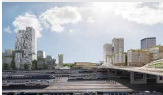
© LES LUMIÈRES PLEYEL / SOGELYM DIXENCE - SNØHETTA - BAUMSCHLAGER EBERLE ARCHITECTEN - CHAIX & MOREL ET ASSOCIÉS - ATELIERS 2/3/4/ - MARS ARCHITECTES - MAUD CAUBET ARCHITECTES - MOREAU KUSUNOKI

entre la future gare Saint-Denis-Pleyel et la gare RER D. Le chantier est gigantesque. Il consiste à construire un pont de près de 300 m de long et 40 m de large enjambant le plus grand réseau ferré d'Europe. C'est également un ouvrage stratégique pour les Jeux olympiques et paralympiques de Paris 2024 puisqu'il permettra aux piétons et aux cyclistes de circuler librement entre le Village des Athlètes, le Stade de France et le Centre aquatique olympique. Il sera l'un des héritages attendus des Jeux 2024, puisqu'il facilitera les déplacements des habitants du quartier Pleyel qui pourront ainsi accéder plus aisément au centre-ville de Saint-Denis.