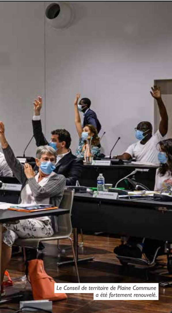
Le Conseil de territoire de Plaine Commune a été fortement renouvelé.