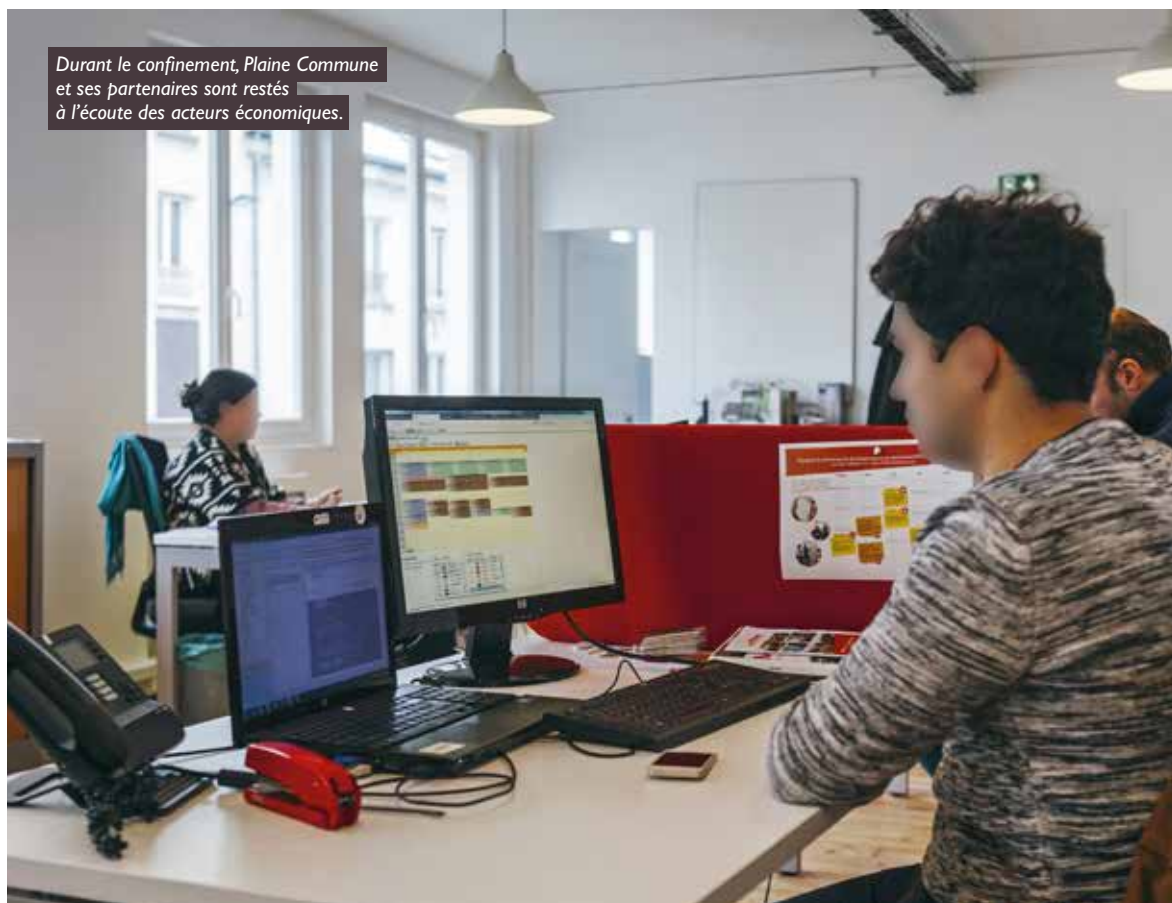
Durant le confinement, Plaine Commune et ses partenaires sont restés à l'écoute des acteurs économiques.

Entreprises du territoire ont sollicité une aide du fonds Résilience , correspondant à un montant de 190 000 euros.