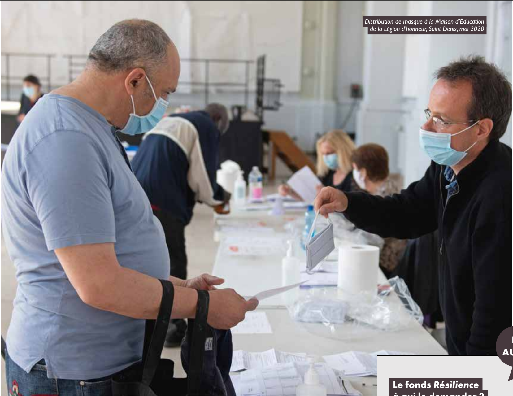
Distribution de masque à la Maison d'Éducation de la Légion d'honneur, Saint Denis, mai 2020