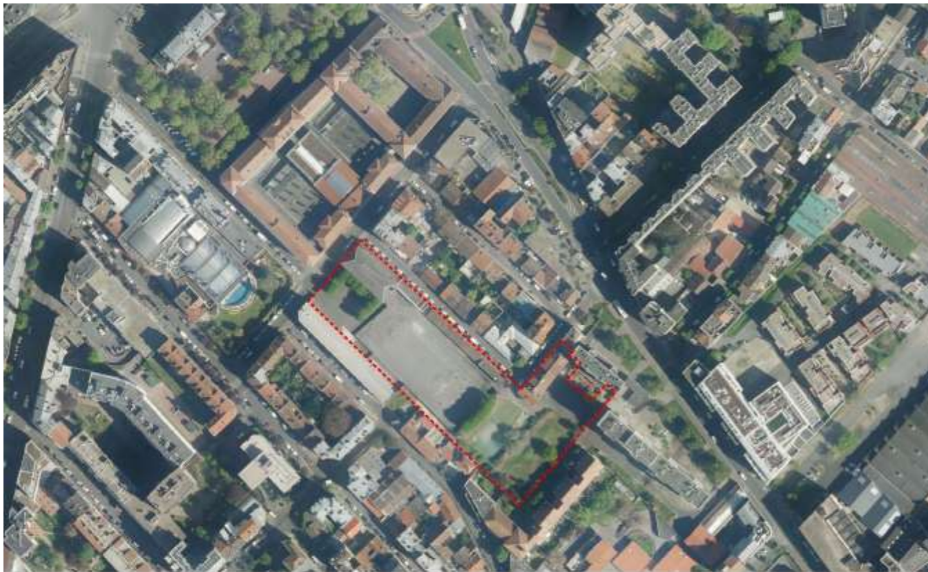
Ampère, vue satellite et périmètre de l'OAP