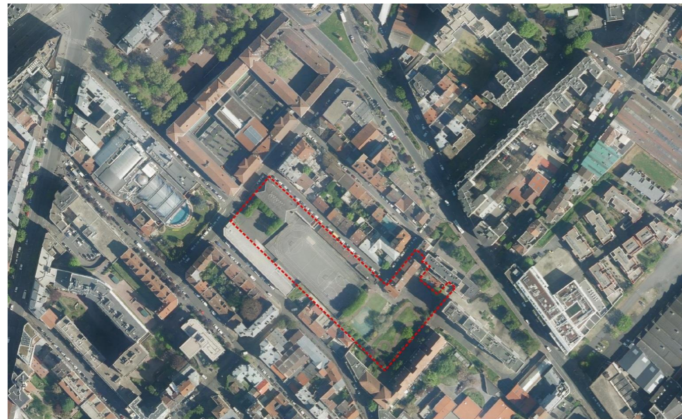
Ampère, vue satellite et périmètre de l'OAP