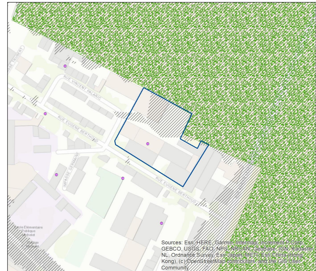
Tableau - Enjeux environnementaux du site d'OAP sectorielle « Palaric ».