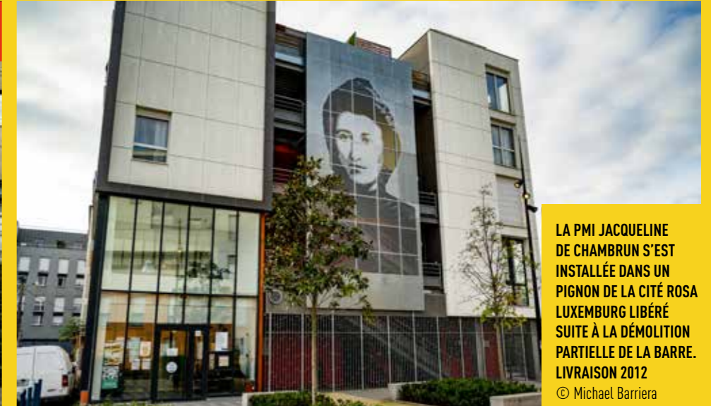
LA PMI JACQUELINE DE CHAMBRUN S'EST INSTALLÉE DANS UN PIGNON DE LA CITÉ ROSA LUXEMBURG LIBÉRÉ SUITE À LA DÉMOLITION PARTIELLE DE LA BARRE. LIVRAISON 2012