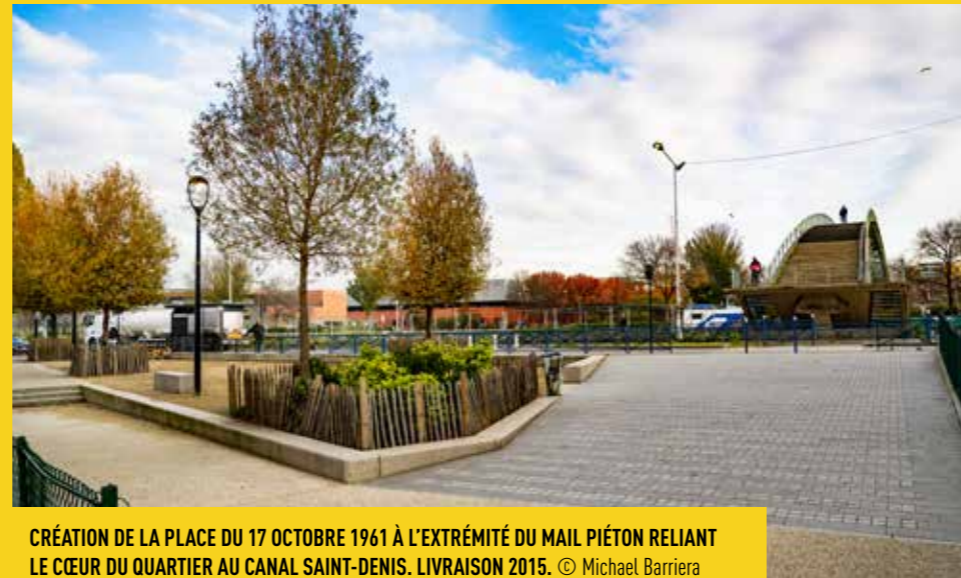
CRÉATION DE LA PLACE DU 17 OCTOBRE 1961 À L'EXTRÉMITÉ DU MAIL PIÉTON RELIANT LE CŒUR DU QUARTIER AU CANAL SAINT-DENIS. LIVRAISON 2015.