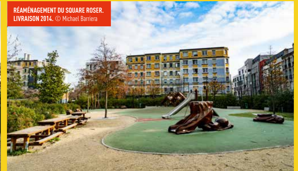
RÉAMÉNAGEMENT DU SQUARE ROSER. LIVRAISON 2014. © Michael Barriera