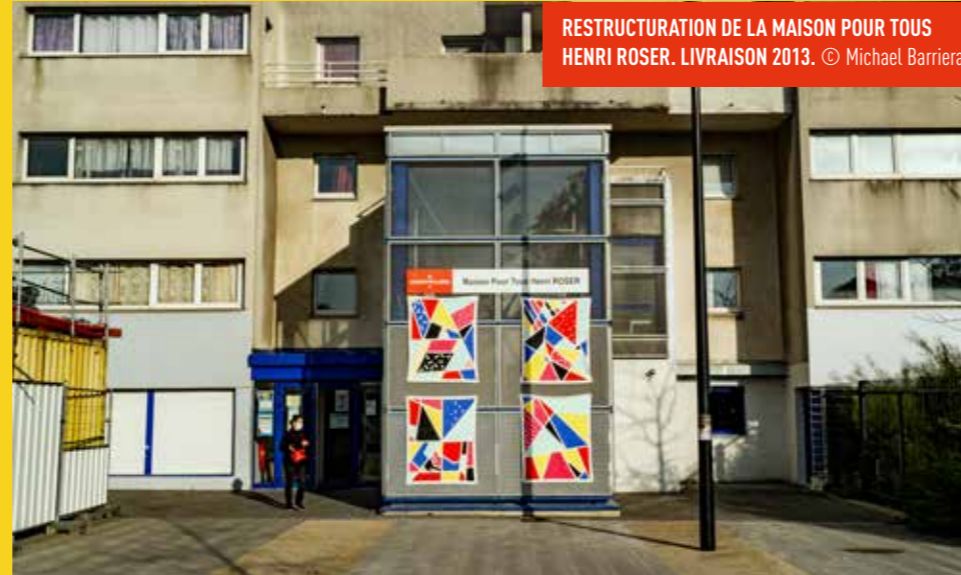
RESTRUCTURATION DE LA MAISON POUR TOUS HENRI ROSER. LIVRAISON 2013.