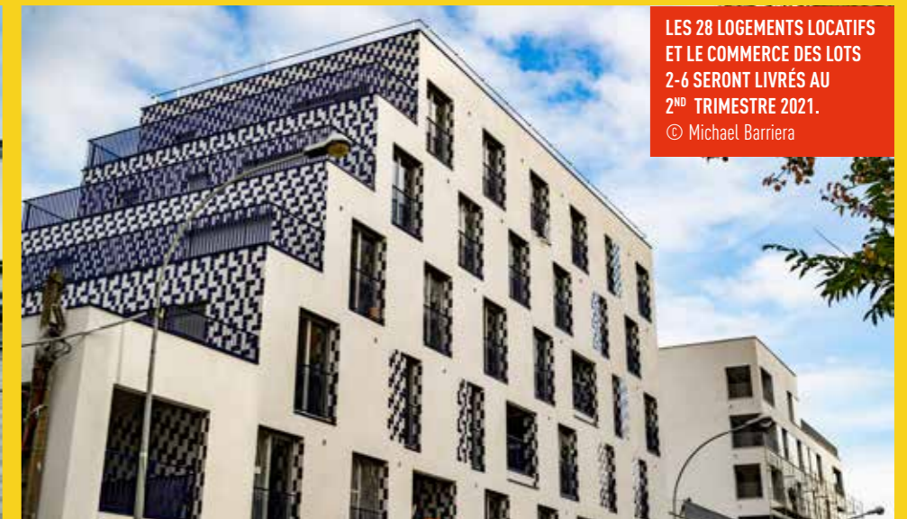
LES 28 LOGEMENTS LOCATIFS ET LE COMMERCE DES LOTS 2-6 SERONT LIVRÉS AU 2 ND TRIMESTRE 2021.