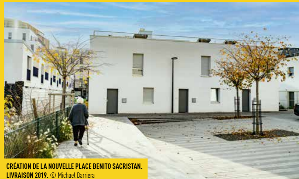
CRÉATION DE LA NOUVELLE PLACE BENITO SACRISTAN. LIVRAISON 2019.