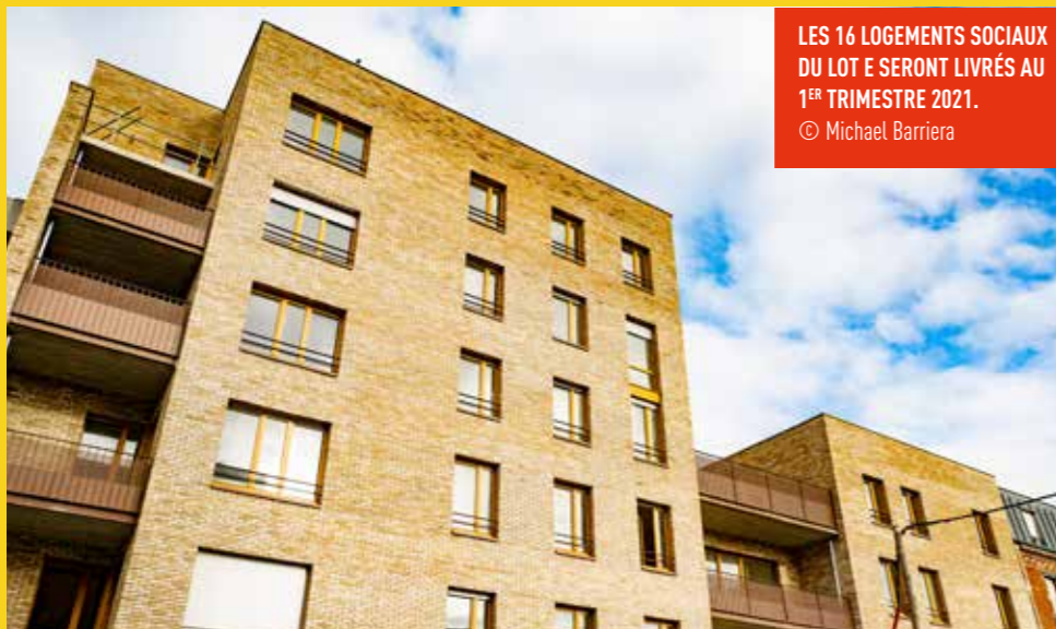
LES 16 LOGEMENTS SOCIAUX DU LOT E SERONT LIVRÉS AU 1 ER TRIMESTRE 2021.