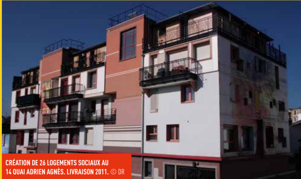
CRÉATION DE 26 LOGEMENTS SOCIAUX AU 14 QUAI ADRIEN AGNÈS. LIVRAISON 2011.