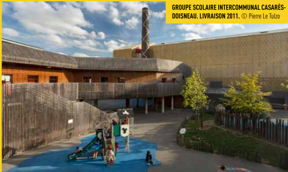
GRUPE SCOLAIRE INTERCOMMUNAL CASARÈS-DOISNEAU. LIVRAISON 2011.