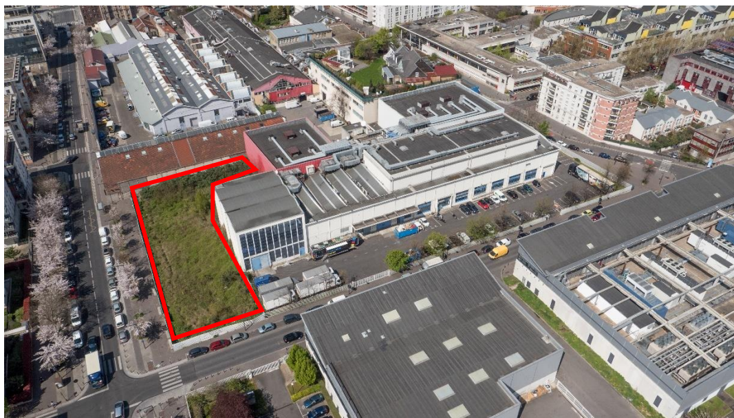
Vue aérienne de la friche