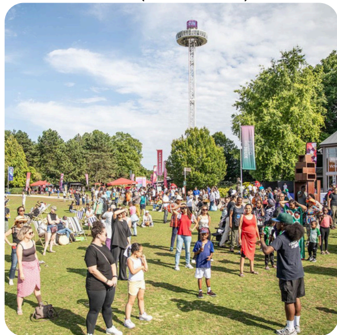
242 837 VISITEURS AU PARC DES JEUX - (LA COURNEUVE)