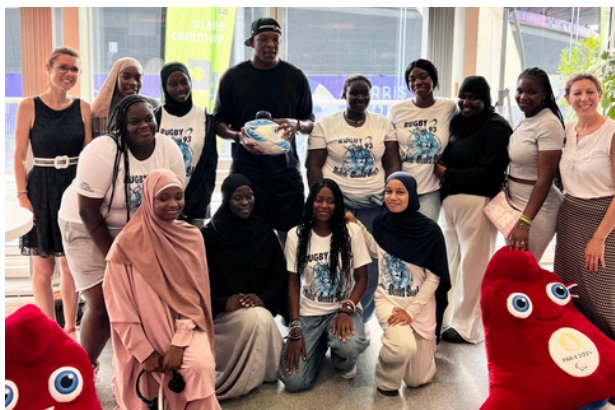
LES CADETTES DE RUGBY DE SAINT-DENIS AVEC CAMERON WOKI, JOUEUR INTERNATIONAL FRANÇAIS DE RUGBY A XV