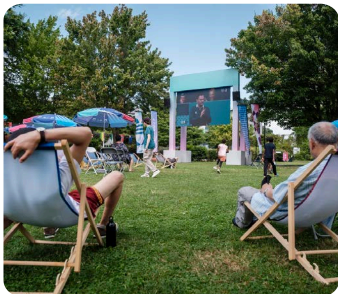
16 000 VISITEURS AU GREEN CLUB: FAMILLES ET CENTRES DE LOISIRS (AUBERVILLIERS)