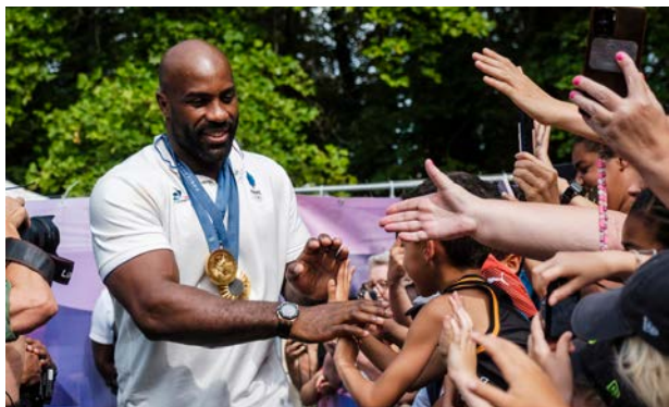
TEDDY RINNER À LA LEGION D'HONNEUR, SAINT-DENIS