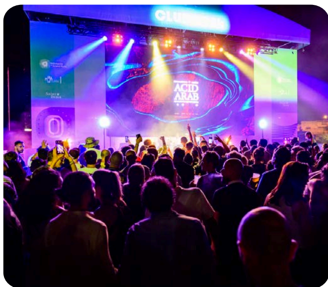
70 000 VISITEURS: HABITANTS ET TOURISTES ONT PARTAGÉ LEUR FERVEUR - LE STADIUM (SAINT-DENIS)