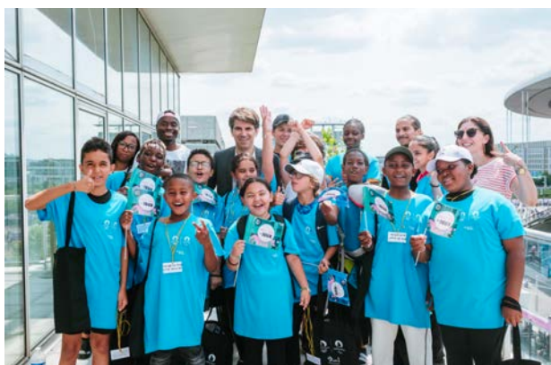
+ DE 200 ENFANTS ACCUEILLIS À PLAINE COMMUNE AVANT D'ALLER AU STADE DE FRANCE !