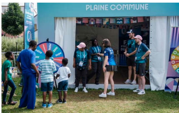
TIRAGE AU SORT JOURNALIER AU GREEN CLUB À AUBERVILLIERS POUR GAGNER DES PLACES