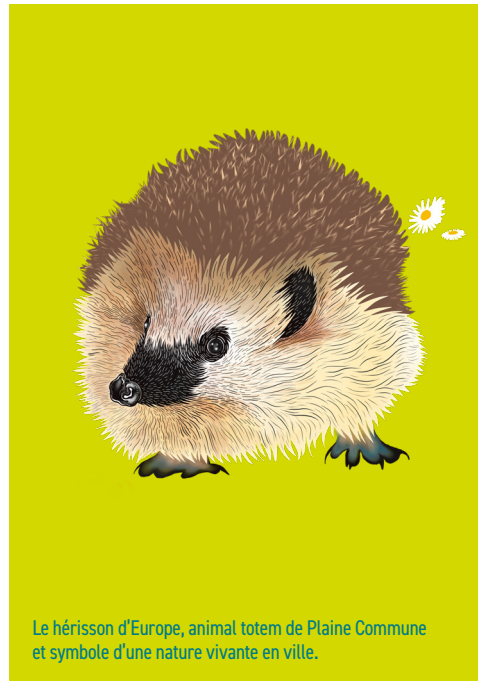
Le hérisson d'Europe, animal totem de Plaine Commune et symbole d'une nature vivante en ville.

Depuis 2025, des travaux de dépollution sont menés sur les 7 hectares de sols du parc Marcel Cachin. Les terres polluées sont soit retirées et traitées dans des filières spécialisées, soit confinées sur site par un géotextile et une couche de terre saine pouvant atteindre 80 cm selon les zones. Le montant des travaux de traitement des sols s'élève à près de 1,6 million d'euros.