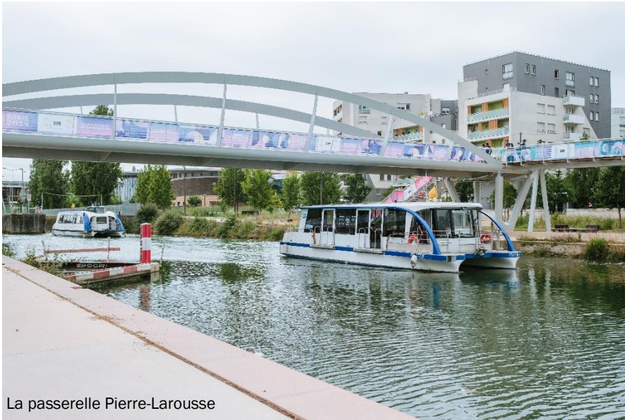
La passerelle Pierre-Larousse