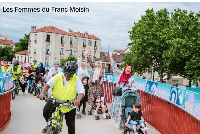
Les Femmes du Franc-Moisin