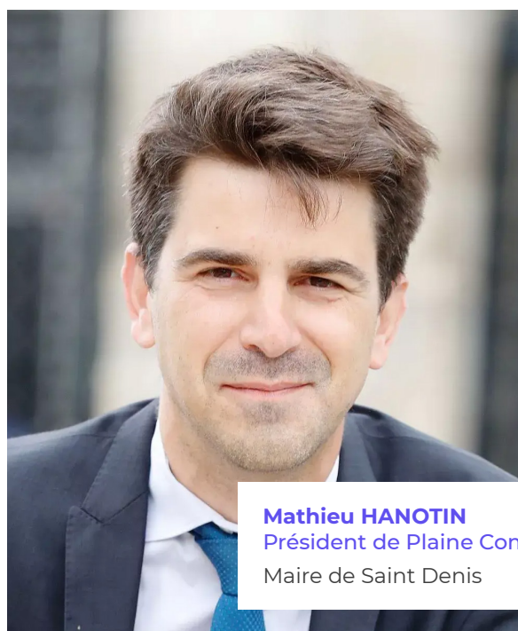
Mathieu HANOTIN Président de Plaine Commune Maire de Saint Denis

Au-delà du respect de l'échéance internationale de 2024, et bien plus qu'un simple ouvrage d'art, le FUP est un élément central d'une dynamique pour Plaine Commune et Saint-Denis.