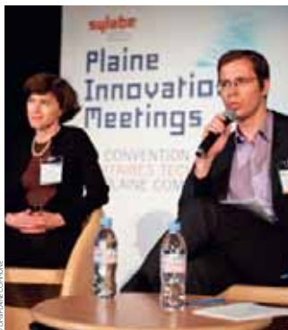
Plaine Innovation Meetings, la convention d'affaires en Île-de-France sur l'Open Innovation

Comment valoriser les activités des laboratoires de recherche actifs sur notre territoire ? Comment combiner les compétences des diverses structures économiques ? Le futur campus Condorcet, la nouvelle Maison des sciences de l'Homme dessineront – avec Paris 13 et Paris 8 – une véritable colonne vertébrale du territoire autour des savoirs et de la connaissance. Plaine Commune multiplie les actions destinées à faire connaître ce pôle scientifique d'excellence et à créer des passerelles entre le monde universitaire, de la recherche et celui des entreprises. Divers événements – Plaine Innovation Meetings, Savante banlieue, Sylabe – contribuent à essayer ces synergies.