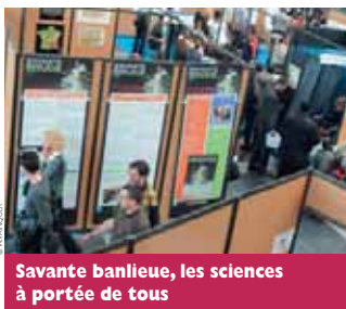
Savante banlieue, les sciences à portée de tous

Sylabe – entendez synergies, laboratoire de recherche/entreprise – s'inscrit dans la continuité des Déjeuners de la technologie initiés en 2004 pour créer des liens entre les centres de recherche et les PME. Depuis, des coopérations se sont mises en place avec l'accueil de stagiaires, de doctorants ou de contrats de prestation. Avec à la clé une base de données nationale « Plaine technéo » qui présente les compétences scientifiques des deux universités, du Cnam et de Sup Méca. Cent cinquante compétences ont ainsi été recensées, susceptibles d'intéresser les entreprises. Elles peuvent ainsi trouver le bon partenaire pour développer leur produit.