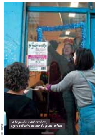
La Fripouille à Aubervilliers, agora solidaire autour du jeune enfant