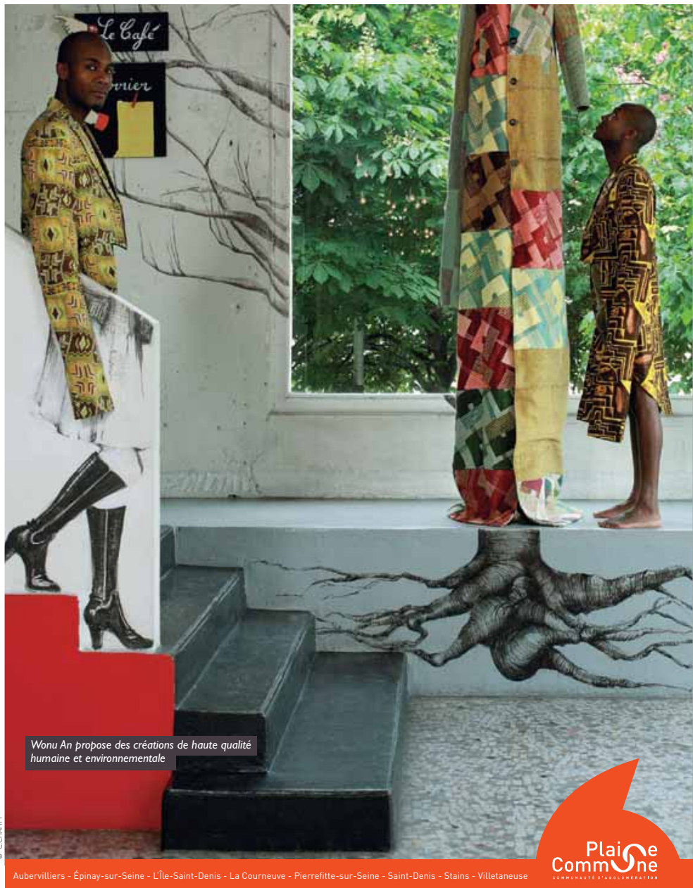
Wonu An propose des créations de haute qualité humaine et environnementale

Le Mois de l'économie sociale et solidaire : c'est en novembre ! Pour cette occasion, l'Éco de Plaine Commune part à la découverte des acteurs qui, sur le territoire, œuvrent pour une économie plus humaine.