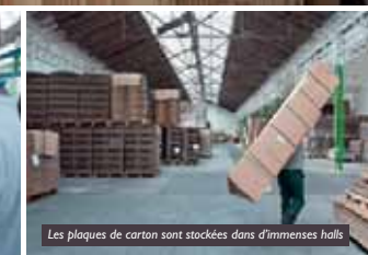
Les plaques de carton sont stockées dans d'immenses halls