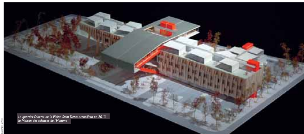
Le quartier Diderot de la Plaine Saint-Denis accueillera en 2013 la Maison des sciences de l'Homme

Pour en savoir plus : www.savantebanlieue.com