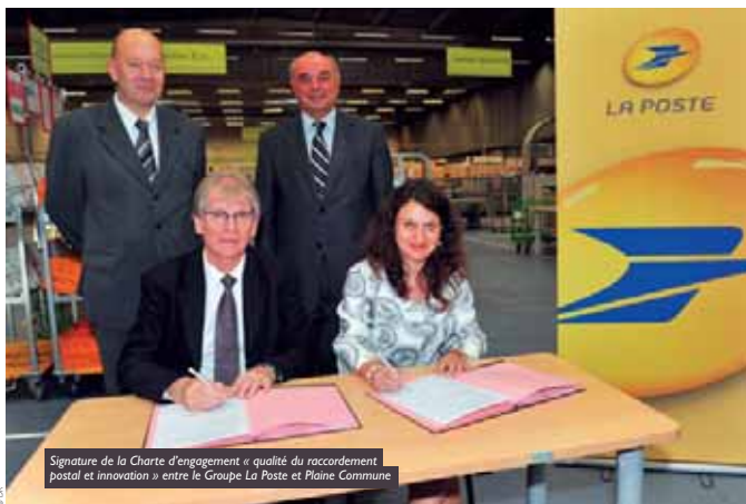
Signature de la Charte d'engagement « qualité du raccordement postal et innovation » entre le Groupe La Poste et Plaine Commune