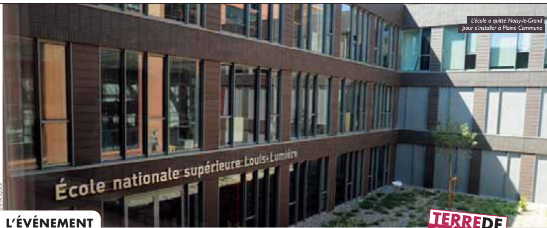
L'école a quitté Noisy-le-Grand pour s'installer à Plaine Commune

La 18 e édition des Rencontres annuelles de Plaine Commune Promotion se tiendra en partenariat avec la Maison de l'initiative économique locale (MIEL). Plus de 500 participants, entreprises et acteurs institutionnels, se retrouveront pour échanger et évoquer notamment l'arrivée de Saint-Ouen dans Plaine Commune.