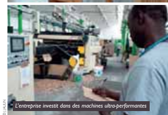
L'entreprise investit dans des machines ultra-performantes