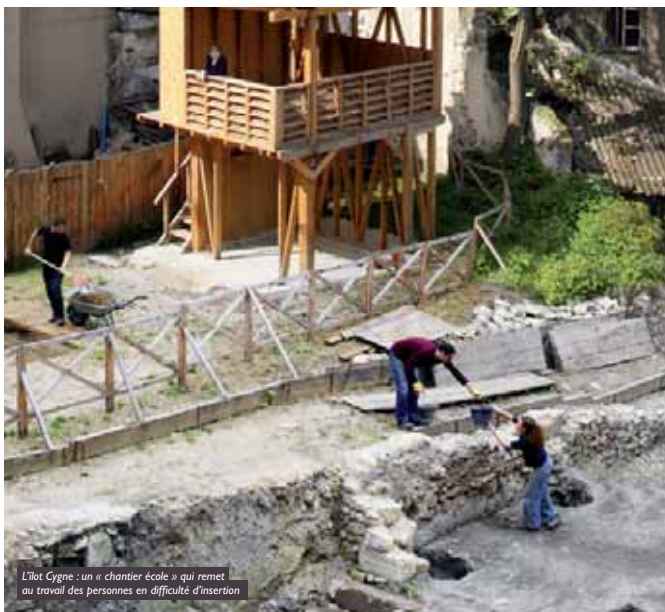
L'Îlot Cygne : un « chantier école » qui remet au travail des personnes en difficulté d'insertion

91,8% des structures de l'ESS répondent au statut associatif.