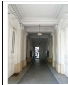
Pan coupé au croisement des rues Catulienne et de la République, façade postérieure de l'aile boulevard Jules Guesde, passage cocher et détail de la sculpture de façade rue de la République. Département de la Seine-Saint-Denis, DCPSL, SPC