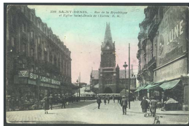
2 Fi Saint-Denis 797 : carte postale postérieure à 1913, on reconnaît à droite l'immeuble du 86 rue de la République