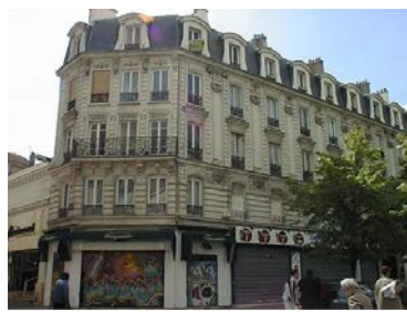
Façade rue de la République et boulevard Jules Guesde Département de la Seine-Saint-Denis. DCPSI - SPC