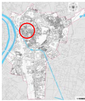
Plan de situation