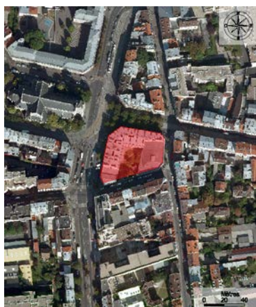
Vue aérienne du quartier - 1/5000