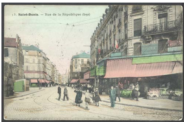
Ci-dessus 2 Fi Saint-Denis 60 et ci-dessous 2 Fi Saint-Denis 365 : carte postales antérieures à 1913 : l'immeuble du 86 rue de la République (emplacement à l'extrémité gauche) n'est pas encore édifié.