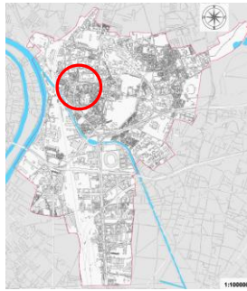
Plan de situation