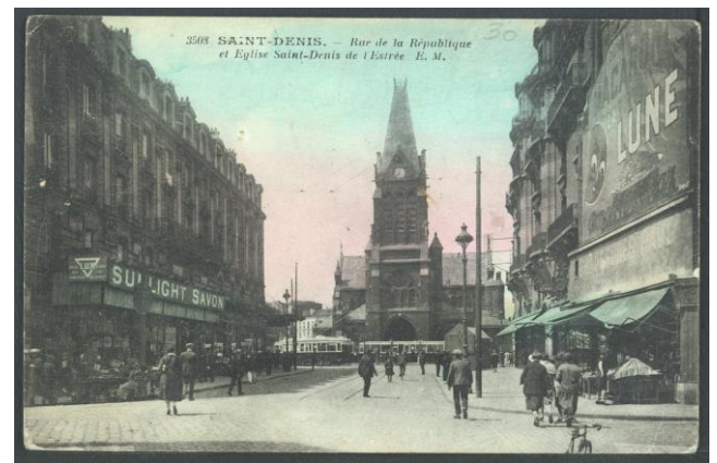
2 Fi Saint-Denis 797 : carte postale postérieure à 1913, on reconnaît à droite l'immeuble du 86 rue de la République