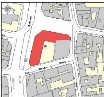
Plan cadastral DGI 1/2500