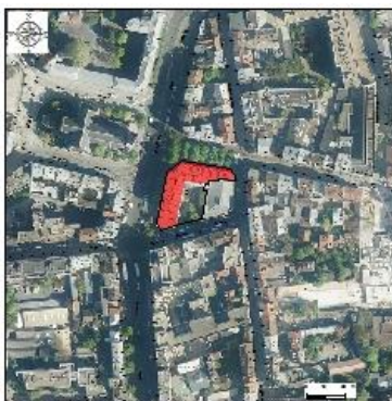
Vue aérienne du quartier - CG 93 - © Aérodata 2017-1/5000