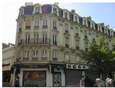
Façade rue de la République et boulevard Jules Guesde

Département de la Seine-Saint-Denis, DCPSL, SPC