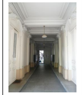
Pan coupé au croisement des rues Catulienne et de la République, façade postérieure de l'aile boulevard Jules Guesde, passage cocher et détail de la sculpture de façade rue de la République.