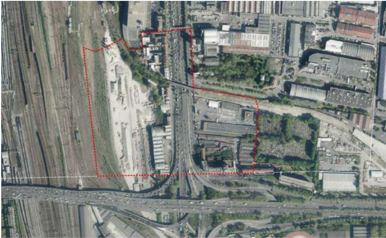
Porte de la Chapelle, vue satellite et périmètre de l'OAP