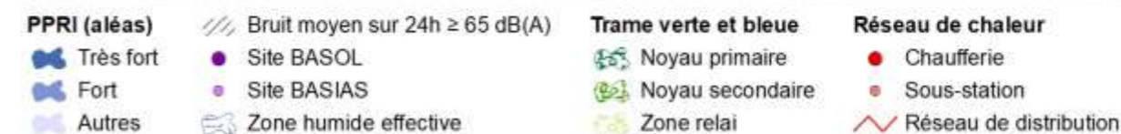
Carte - Contexte environnemental du site d'OAP sectorielle « Porte de La Chapelle ».