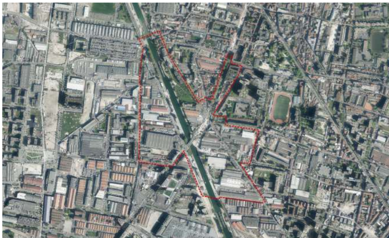
Pont de Stains, vue satellite et périmètre de l'OAP